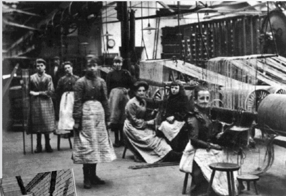
Dans un atelier de jute à Dundee en Ecosse vers 1900