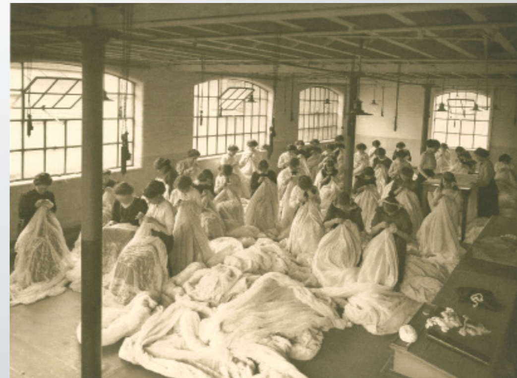
Birkin mending room, University of Nottingham BNN

9/9, Salle Marc Bloch, MSH de Lyon et Saint-Étienne, 14 avenue Berthelot 10/9, Amphithéâtre de la MILC, 25 rue Raulin, 69007 Lyon