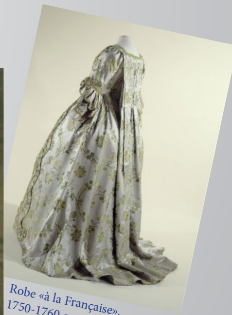
Robe «à la Française», 1750-1760 ca, Palais Galliera, Paris